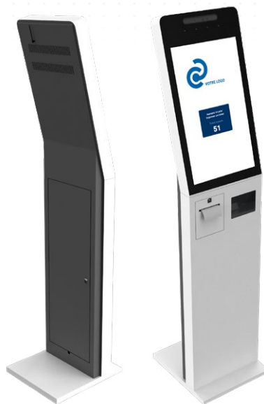
Borne Nairobi 24'' Avec code-barre