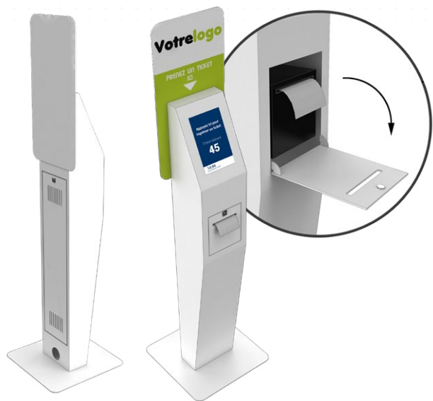
Borne Pronto 10'' ticket Avec TP85