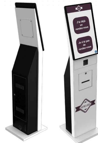
Borne Balden 24'' Avec code-barre

Vous avez un projet sur-mesure ? Consultez-nous pour fabriquer ensemble votre borne selon votre demande.